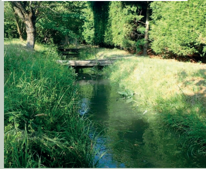
Schéma directeur des canaux de Veynes