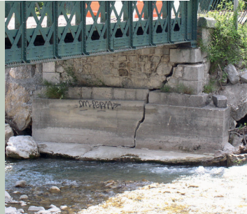
Confortement d'un pont à Saint-Julien-en-Beauchêne