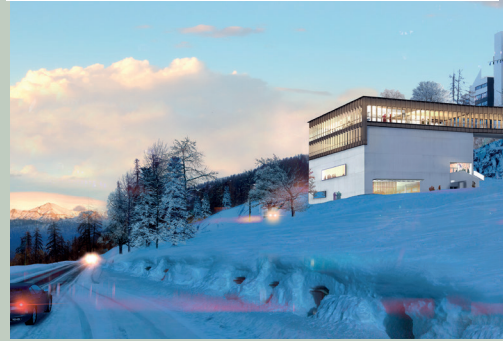
Projet de centre multi-activités de Puy-Saint-Vincent