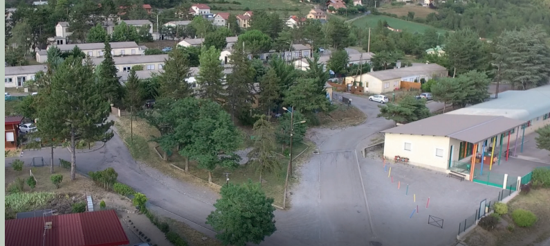
Sélection d'un maître d'œuvre pour la restructuration du quartier du Claps à Espinasses