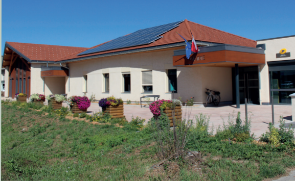
Bâtiment à énergie positive de services publics à Chabottes