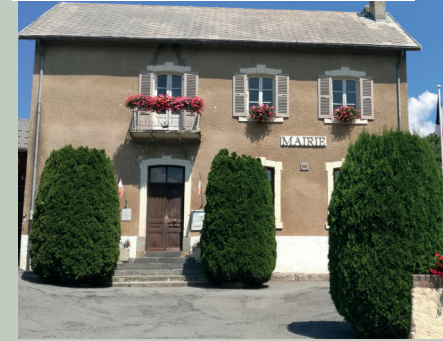
Réhabilitation de la Mairie du Sauze-du-Lac